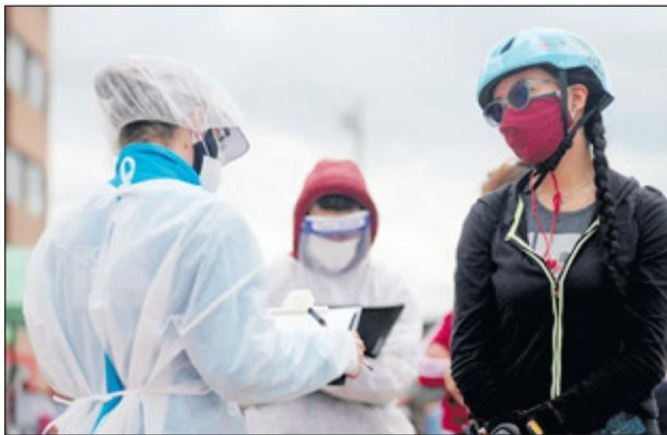
Bogota a registra un total di 42.347 persona infecta y 1.607 caso den 24 ora, mientras cu na nivel nacional e contagiadonan ta 133.973 y 4.714 morto.

Segun e ultimo cifranan di e Ministerio di Salud,